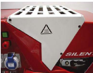
Berührungsschutz Auspuff optimale Abluft