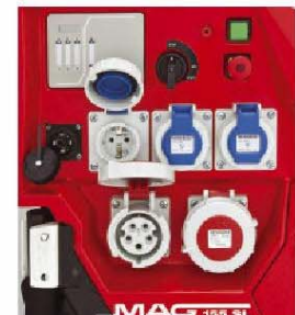
einfach und übersichtlich durch die optimale Anordnung aller Bedienelemente Isolationsüberwachung mit akustischer Warnung durch Hupe nach DIN 14685-1