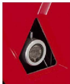
DIN Abgasstutzen mit Funkensieb für Ihre Sicherheit mit Aufnahme für Abgasschlauch